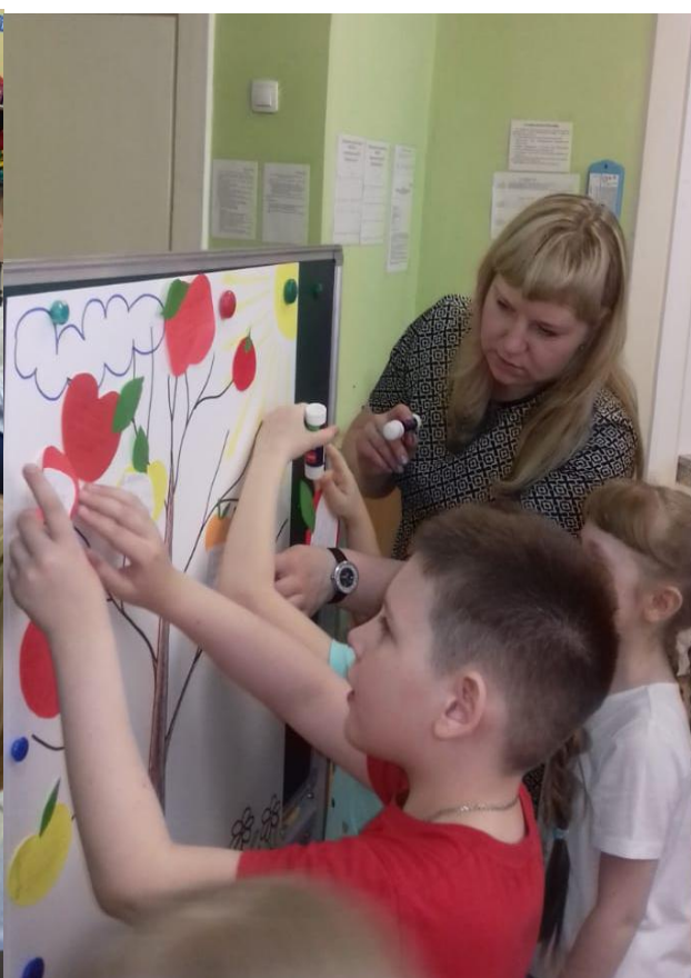
Творческая работа «Яблоня»