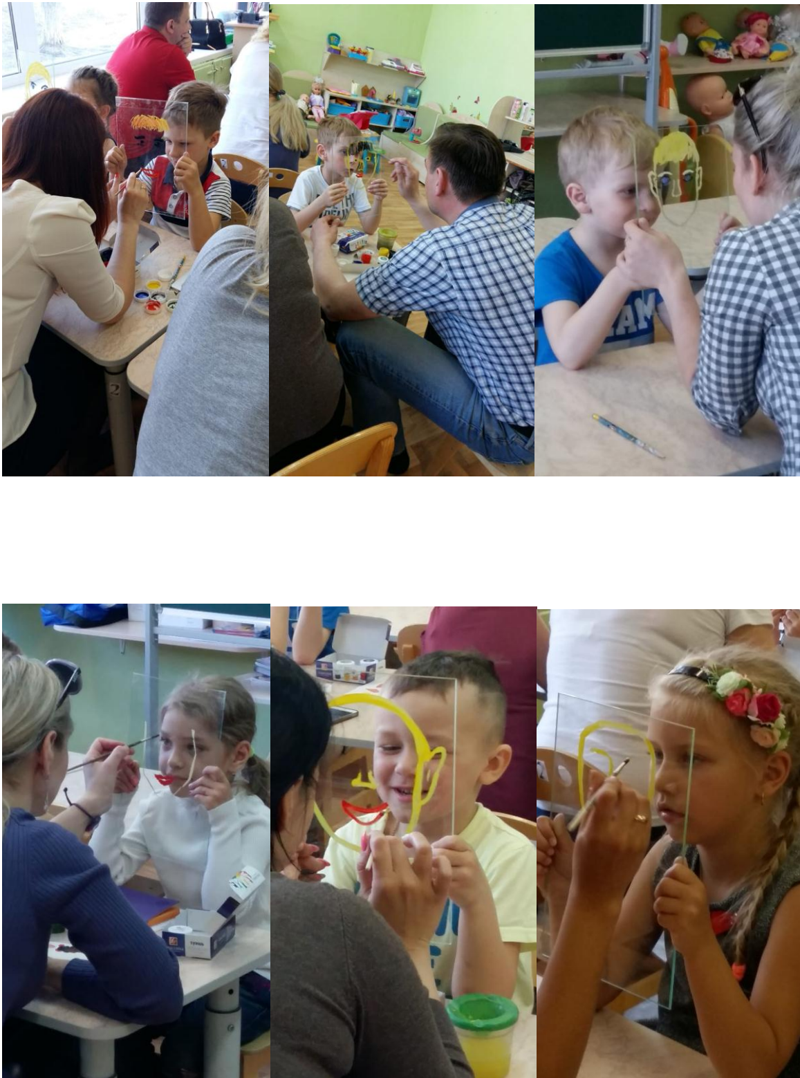
Арт-терапевтическое упражнение «Портрет ребёнка на стекле»