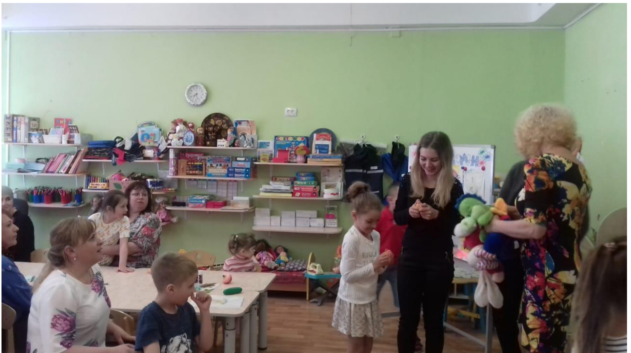
Упражнение «Закончи предложение»