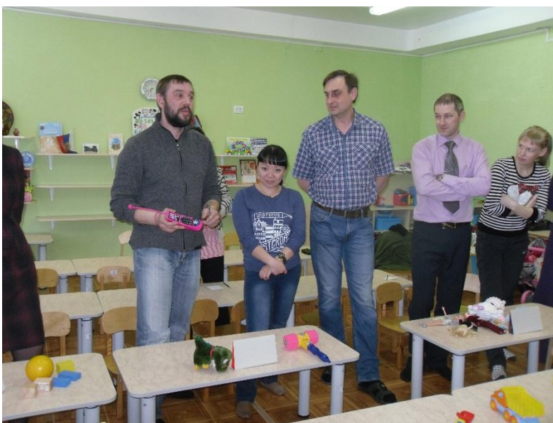
Игровое упражнение «Выбери игрушки»